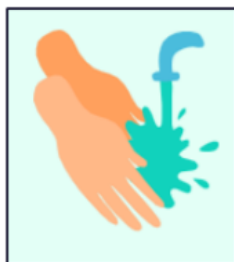
Lavar as mãos