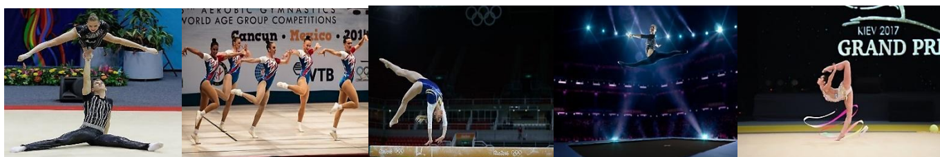
(imagens de ginástica competitivas)