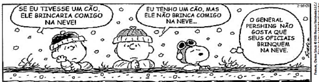
Charles M. Schulz. Minduim. O Estado de S. Paulo , São Paulo, 21 maio 2009. p. D6.

a) Copie a fala do personagem que indica algo incerto irreal que pode ser que aconteça ou não.